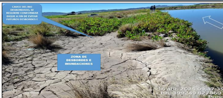
FIGURA 1 y 2: TRAMO CRÍTICO EN EL RÍO COATA, EN EL SECTOR LLUCO-CARATA, DISTRITO DE COATA, PROVINCIA DE PUNO - PUNO, NOTESE, LA MARGEN IZQUIERDA DEL RIO COATA QUE REQUIERE LA CONFORMACION DEL DIQUE FUSIBLE PARA EVITAR EL DESBORDE E INUNDACIONES EN EL RIO COATA. SE OBSERVA TAMBIEN EL AREA DE CULTIVOS AFECTADOS.